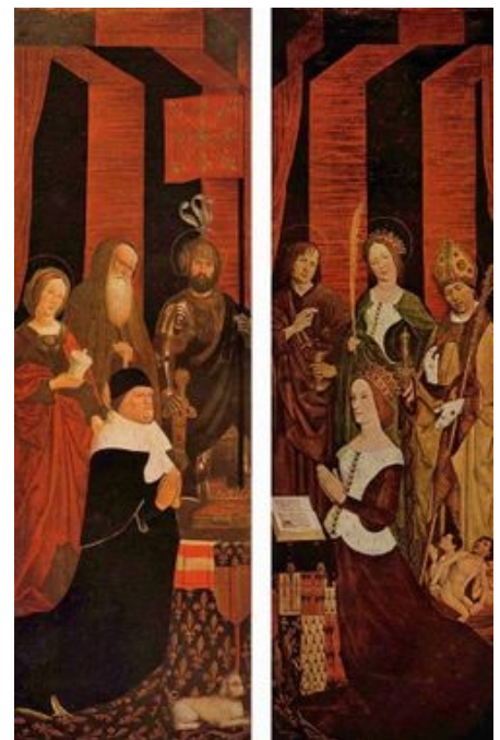
Le roi René et son épouse Jeanne triptyque peint par Nicolas Froment, 1475 cathédrale d'Aix-en-Provence

Par son testament, René laissait à son épouse la jouissance du duché d'Anjou, du comté de Beaufort, de la ville de Perthuis et autres places de Provence ; il lui léguait en outre plusieurs joyaux et meubles précieux. Jeanne conserva l'usufruit de la seigneurie de Mirebeau.