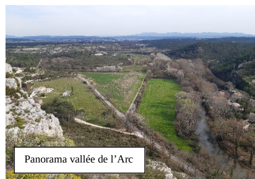
Panorama vallée de l'Arc

Le château fut en partie détruit pendant la Révolution française. Inscrit sur l'inventaire des monuments historiques en 1989, il a subi plusieurs tranches de consolidation.