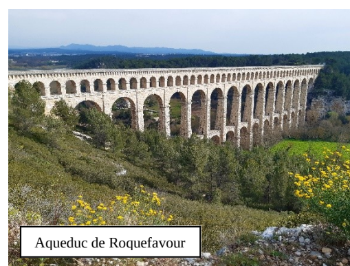
Aqueduc de Roquefavour