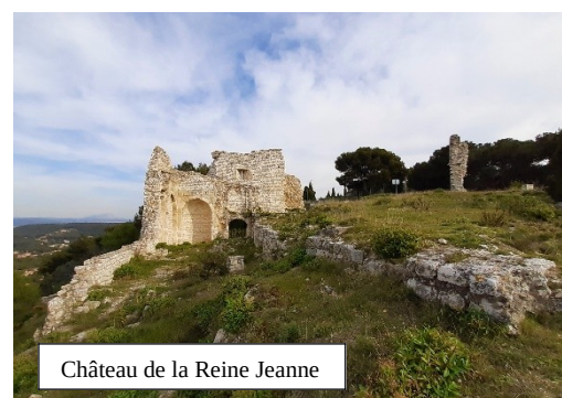
Château de la Reine Jeanne