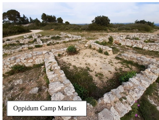
Oppidum Camp Marius