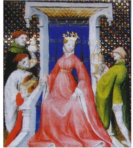
Reine Jeanne de Naples Bible de Naples

Après une escale à Brégançon, Jeanne arriva à Marseille le 20 janvier 1348 où elle reçut un accueil chaleureux. Elle se rendit ensuite à Aix-en-Provence où l'accueil fut très différent, les barons de Provence lui manifestant clairement leur hostilité. Elle dut s'engager sous serment à ne rien aliéner de la Provence et à réserver tous les emplois du comté aux seuls Provençaux. Elle arriva ensuite le 15 mars en Avignon véritable but de son voyage pour y rencontrer le pape. Cette rencontre avait un triple but : obtenir une dispense pour son mariage avec Louis de Tarente, recevoir l'absolution pour être disculpée du meurtre d'André et préparer la reconquête de son royaume.